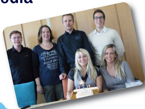
Das Unitymedia Twitter-Team konnte bereits nach knapp vier Monaten den 1.000sten Follower feiern