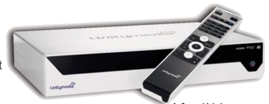
Außen schick, innen ausgezeichnet: Die neue HD Box von Unitymedia

Im Oktober zeichnete die Beratungsgesellschaft „[tbb*]thebrainbehind“ die Unitymedia HD Box unter acht Geräten als Testsieger aus. Insbesondere die einfache Installation, die Menüoberfläche sowie die intuitive Benutzerführung überzeugten. So sorgte der elektronische Programmführer (EPG) dafür, dass der Kunde kein TV-Highlight mehr verpasst. Die Wunschsendung lässt sich direkt im EPG für eine Aufnahme vormerken.