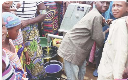
Die „Partnerschaft Piéla“ unterstützt Brunnenbauprojekte in Burkina Faso

Die inhaltliche Ausrichtung der Projekte ist dabei so vielfältig wie die Unitymedia Mitarbeiter selbst: Vom neuen Trikotsatz für die Jugendmannschaft des lokalen Sportvereins, über die Förderung von Kindergarten-Projekten bis hin zu Aktionen zum Erhalt von Tierheimen und vieles mehr. In den vergangenen sieben Jahren wurden so bereits über 80 Mitarbeiter-Projekte in Nordrhein-Westfalen und Hessen gewürdigt und mit einer 500-Euro-Spende von Unitymedia unterstützt.